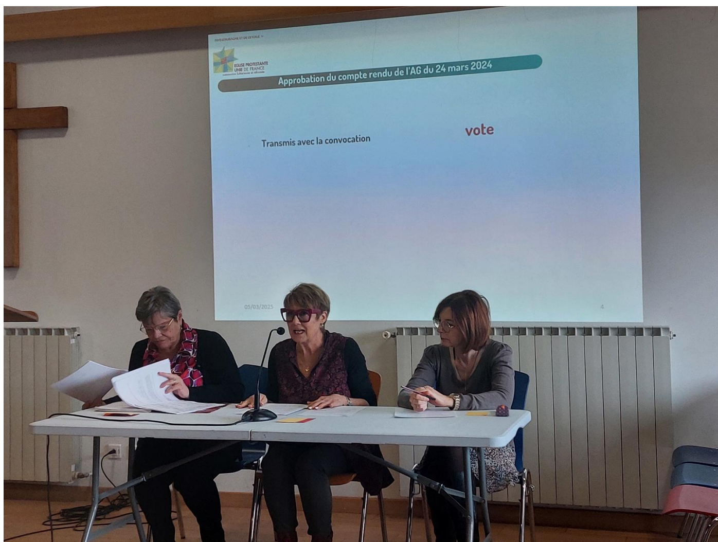
L'équipe de choc qui anime l'AG !

33 personnes avec en plus 10 pouvoirs y ont participé. L'occasion de revenir sur les événements marquant de l'année et d'échanger sur les projets à venir. L'AG a été suivie d'un repas très animé.