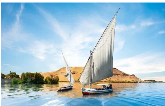
Un voyage spirituel...

Un petit bilan : depuis septembre, quatre groupes ont suivi les étapes d'un des parcours. Un s'est regroupé autour d'un "apérobible" sur le parcours Béréchit; deux autres sur le parcours Shalom : un au temple le vendredi après-midi et un autre dans les maisons ; et enfin un quatrième a testé le parcours Le'Hayim chez des paroissiens. Les participants à ce dernier groupe étaient suffisamment nombreux pour organiser deux ateliers de discussions.