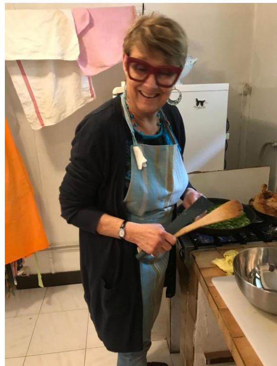
Une préparation du repas dans la bonne humeur