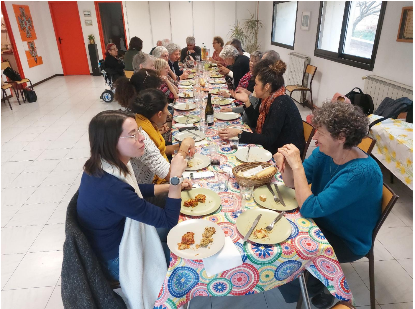
Le repas qui a suivi l'AG, une sacrée tablée.

Le Support de la présentation de l'AG sera joint à l'envoi de la lettre mensuelle, il peut être téléchargé sur le site